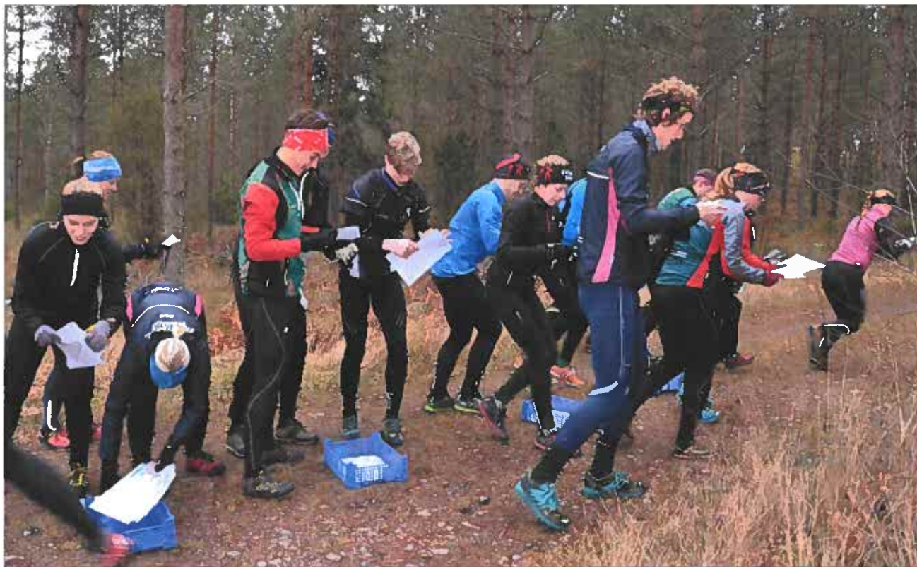
För att nå resultat krävs träning och förberedelser och säsongen 2015 startade redan i december med upptaktsträff i Skidstugan. Alla dessa kanske inte var med och tog SM medaljer mm. men bidrog på olika sätt för att 2015 blev ett fantastiskt fint Eksjö SOK år.

Våra högt uppsatta mål nåddes i stort sett. SM-resultaten var helt fantastiska med 15 st topptio-placeringar varav 8 medaljer. På 10-mila gjorde herrlaget en briljant insats och blev 65:a, 10 placeringar bättre än målet. Ännu en seger för D18 på ungdomens 10-mila!