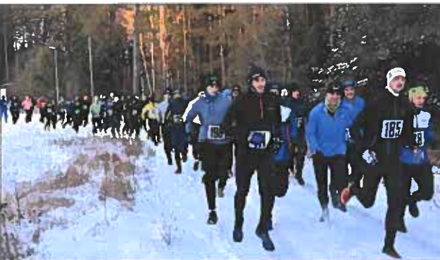
Starten har gått i 2015 års Sylvesterlopp som slog deltagarrekorde med 85 startande deltagare.

När 2015 års Sylvesterlopp avgjordes vid Skidstugan på nyårsafton blev det deltagarrekorde med 85 startande. Tävligen genomfördes för 19:e gången i rad, -1°C och med lite hala och snöiga vägar.