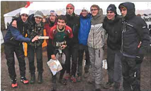
Herrlaget efter målgång och det blev en fin 65:e plats till slut.

Ungdomarna hade två ganska jämna lag. Lag 1 fick en tung inledning men sedan plockade de tre resterande sträckorna 23, 62 och 32 lag och slutade på en 129:e plats. Lag 2 hade en hyfsad inledning, jobbade upp sig på andra sträckan för att sedan få en tung avslutning och slutade 184 av 282 startande lag.