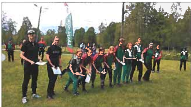
Klart för start i årets Gängbudkavle som i år samlade 11 lag.

Två dagar efter midsommarafton gick årets gängbudkavle av stapeln. Efter en hel del funderande och analyserande om var tävlingen skulle arrangeras så hamnade vi i Lövhult utanför Nässjö. 11 lag kom till start och det bestämdes att mellanbanan startade därefter sprang de på korta banan och den långa banan fick avsluta dagens tävling med en varvning efter halva banan.