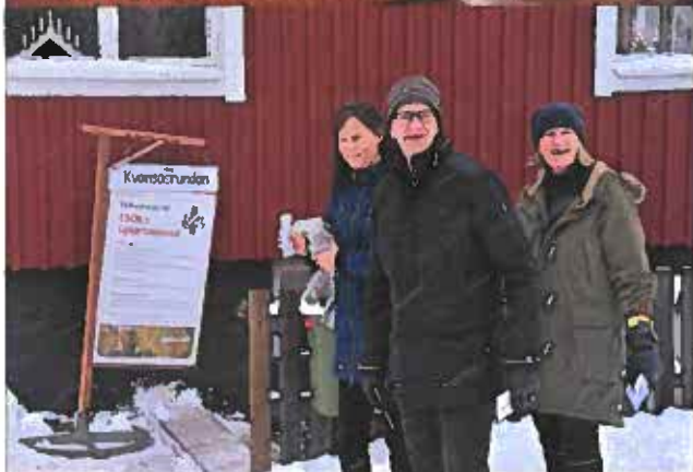
Tipspromenad och snö och kyla ute, fika och värme inne.