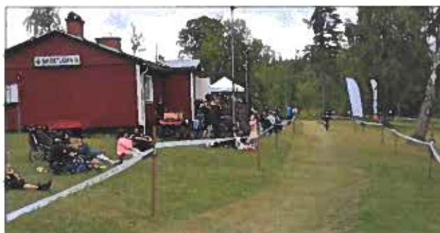
Skidstugan används året runt till olika aktiviteter. Här från året Ränneslättstur där cyklisterna passerar två gånger varav ena gången då det är spurtpris och andra gången för vätskepåfyllning.

Då huvuddelen av sektionens medlemmar tillhör den s k tisdagsgruppen sker all planering kring verksamheten ute i Skidstugan vid tisdagsträffarna. Detta innebär att gruppen har träffats ca 25 gånger under året. Två möten har genomförts med sektionen.