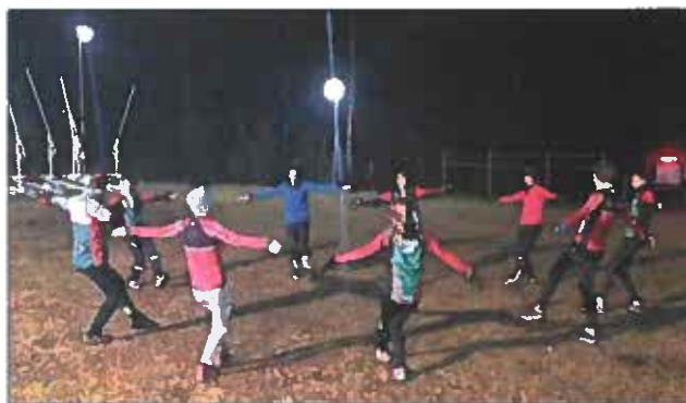
Försäsongsträning och i det här fallet vid Skidstugan en torsdagskväll

Vi har haft 3st träningsgrupper för olika åldrar. Grupp1 (13-16år), grupp 2 (10-12år), grupp 3 (8-9år), enbart