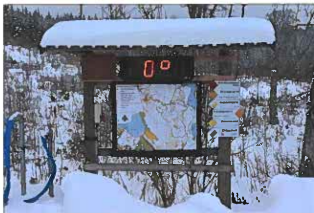
Temperatur och spårkarta är en del av servicen de som ska ut på en tur i Skidstugeområdet får.