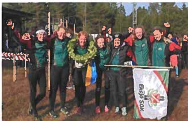
De grymma tjejerna som gjorde det och förde Eksjö SOK till fjärde segen på de senaste fem åren i D18 på U-10 mila.