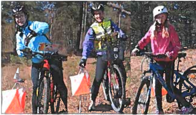
Glad minner från deltagarna vid påsken mtbo närtävling som samlade ca 40 deltagare.

Under året har en Småländsk träningscup utvecklats och startats upp med antal arrangemang i närtävlingsform. Eksjö SOK har arrangerat ett sådant arrangemang under året samt ytterligare en närtävling. Dessa arrangemang var i påskhelgen samt en kvällstävling i slutet av maj. Guppabackarna och Brännemon var terrängområdena vid dessa tillfällen.