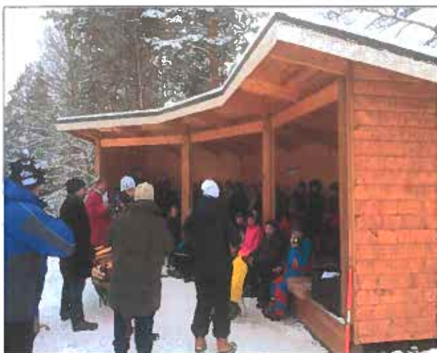
Förra årets nybygge, vårt vindskydd, har använts i många sammanhang både som här för skolverksamhet men även tyvärr vandaliserats med förg under året. Dock sanerat och fint igen.

I september genomfördes en städdag där en hel del medlemmar ställde upp. Garaget och området runt vallaboden samt förrådet vid Högefälle fick en välbehövlig ansiktslyftning. Vallaboden fick också ny ytterbeklädnad. Med stöd av ungdomar från kommunen målades omklädningsbyggnaden och vallaboden.