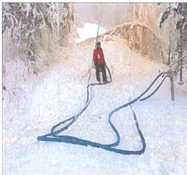
Mycket vatten går åt för att tillverka snö men vitt blir det när det väl är minusgrader.

Stugan har varit uthyrd ett stort antal dagar under 2015. Därutöver har många nyttjat området runt stugan för grillkvällar, pulkaåkning och andra aktiviteter. Skidstugan har även detta år varit ett attraktivt utflyktsmål för många Eksjöbor.