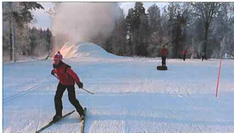
Säsongens snöproduktion kom igång i slutet av december och som här producerades det snö så fort det var minusgrader.

Året inleddes dock inte med orientering utan det var konstsnön som präglade de första månaderna av året. Snöproduktionen kom igång under julhelgen och efter några dagar var det fullt med skidåkare i spåren. Spårkort såldes och spår drogs upp. Dagar, kvällar och helger var det fullt med bilar på parkeringen och det visar att Eksjö Skidstuga är kommunens friluftsanläggning där vi som förening gör en stor insats för att erbjuda allmänheten motionstillfällen.