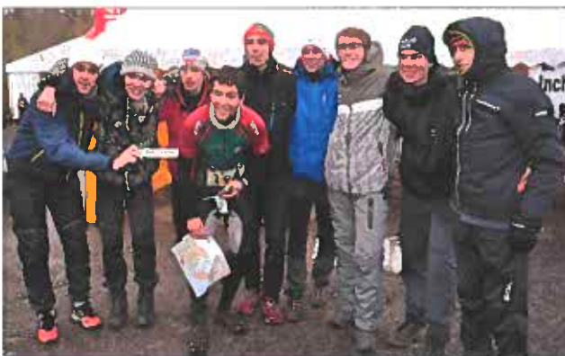
Killarna sprang in på en av de bästa placeringarna på många år i 10mila då de blev 65:a vilket var 10 placeringar bättre än målsättningen.

Killarna följde upp förra årets andra plats med att erövra en fantastisk 6:e plats som nästa bästa Svenska lag! På 10-mila gjorde våra tjejer det riktigt bra och blev 41:a, en liten bit bakom målet som var topp 30. För killarna blev det en positiv 65:a plats, tio placeringar bättre än målet på topp 75!