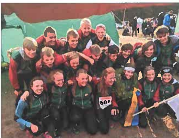
U10mila, 6:a (HD18) och 1:a (D18) och HD12 hamnade på en 76:e plats med över hundra startande lag i den klassen.