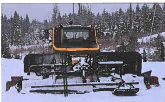
Bra maskin att ha vid spår tillverkning men en rackare på att gå sänder.....

Vi kan se tillbaka på en ganska bra skidvinter 2015. Detta tack vare vårt nya konstsnöspår. Spåren vid Skidstugan var ett av de få spår på Höglandet som kunde erbjuda bra spår ända fram till slutet av mars. Vi sålde bl a spårkort som gav bra inkomst.