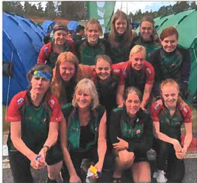
Tre tjejtag-lag hade vi med på årets Jukola eller rättare sagt Vendela.

Jukola 2015, ESOK:s största representation någonsin på Jukola, tre damlag och tre herrlag! Vi kan verkligen säga att resan blev en succé, och känslan är nog att även våra juniorer/seniorer mår bra av att några äldre var med så vi blev ett stort gäng.