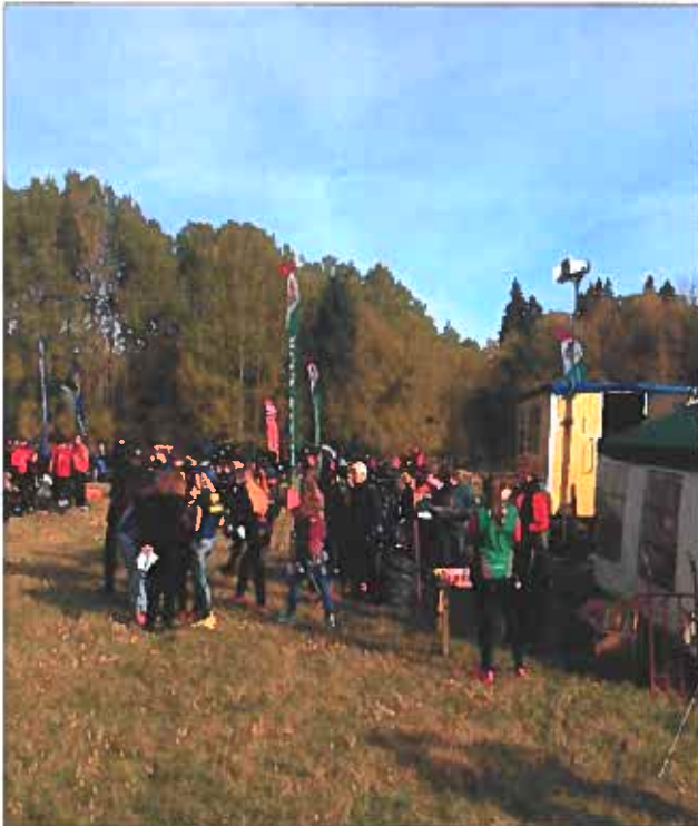
Skol SM arrangerade vi i början av oktober och vi fick goda omdömen kring tävlingarna som hade Kvarnarp som tävlingsområde för sprinten och Skedhultsområdet för långdistansen.

Ytterligare arrangemang som vi gjorde under hösten skedde första helgen i oktober då vi arrangerade Skol-SM. Ett arrangemang som gav ett positivt tillskott i kassan och där vi också fick fin respons från tävlande för vårt arrangemang.