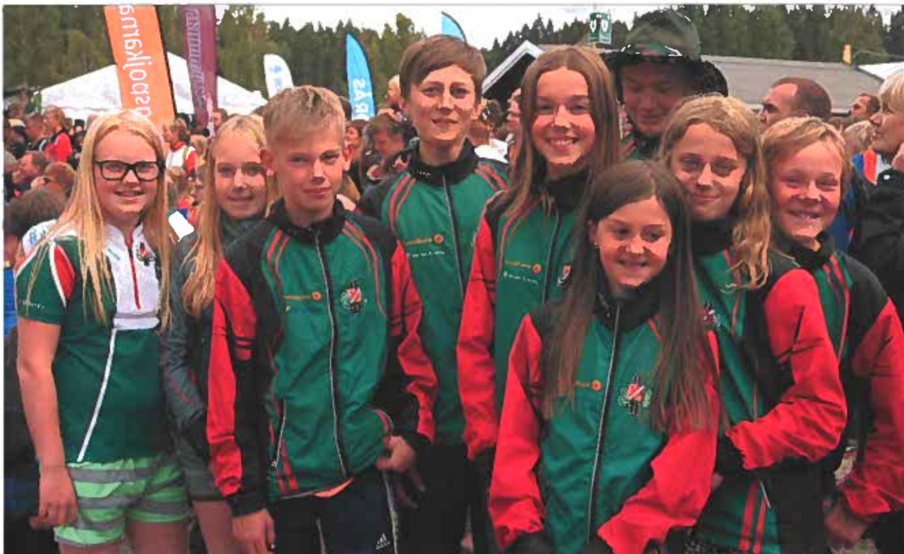
Eksjö juniorer/seniörer har under året skördat massor av framgångar men för att en klubb ska fortsätta utvecklas behövs påfyllning underifrån och förhoppningsvis kommer dessa ungdomar att inspireras och få möjlighet att nå sina mål. Bilden är från årets Öringen.

Eksjö SOK har i samarbete med Smålands Orienteringsförbund genomfört propagandaverksamhet under vårterminen 2015. Aktiviteterna har omfattat 2 dagar då skolorna inbjudits till friluftsdagar i Skidstugan. Ca 300 deltagare totalt och ca 5 ledare/dag.