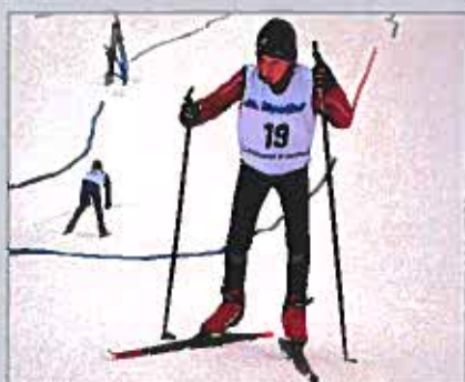
ZONTÄVLING I LANDSBRO